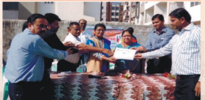
નવસારી નગરપાલિકા, બી.પી. બારીયા સાયન્સ ઈન્સ્ટિટ્યૂટ, નવસારી, NSS વિભાગ તથા સ્વામી વિવેકાનંદ યુવક મંડળ